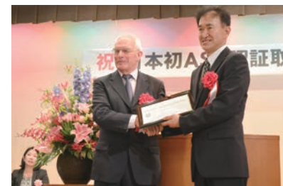
ASC認証の取得伝達式