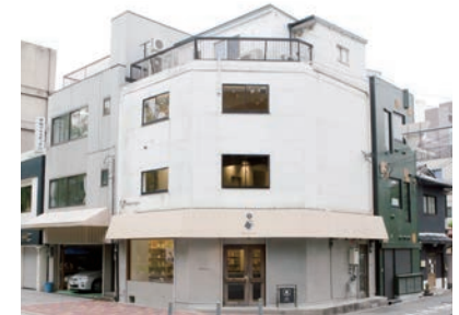
ハローライフ外観

他方、求職者が置かれている状況も厳しい。雇用の流動化の負の側面として非正規雇用が増大し、「すべり台社会」と形容されるように就活での失敗や病気による離職など何かのトラブルで一度ルールを踏み外すとその後の就活が不利になり、そのまま困窮状態にまで陥ってしまう若者が増えている。そのような中、ハローライフではコミュニティや場づくりを通じた就職支援を提供している。これらのプログラムの先にあるのは、企業が優秀な人材を獲得することだけでも、自己実現だけでもない。「働く」を通じて人々の暮らしを豊かにすることである。