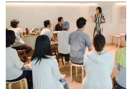
縁就活などのイベント