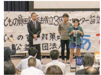
2016年6月「法成立3周年・あすのぼ設立1周年の集い」を開催。奨学金の負担軽減等を訴える「あすのぼ提言」を発表した。