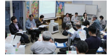
SDGs関係者を招いて環境パートナーシップ会議(EPC)が開催している「サステナビリティ円卓会議」の様子

分野横断型の課題を解決するには、パートナーシップが不可欠。持続可能な開発のため実施手段の強化とグローバル・パートナーシップの活性化のためには、「資金」「技術」「能力開発」「貿易」の他、「政策・制度」「マルチステークホルダー・パートナーシップ」「データ、モニタリング、説明責任」が重要だと記されている。